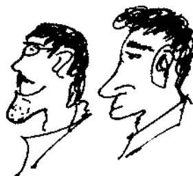
Sie oder Sie oder Sie nicht !