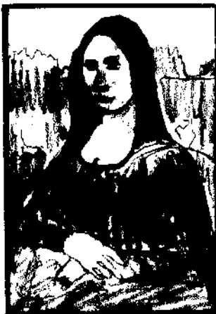
Original: Mona Lisa